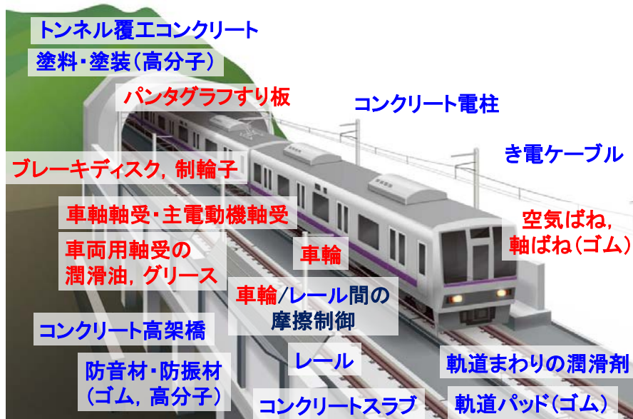
図1 鉄道用材料に関する最近の取り組みの対象 (青文字：施設関連，赤文字：車両関連)

鉄道用材料の研究開発において、近年取り組みの対象となっているものを図1に示す。車両用、施設用に大別され、施設用については構造物、軌道、電力など、それぞれの用途に分類される。加えて車輪／レール間の摩擦制御など、車両・施設の両方からのアプローチが必要な境界分野にも及んでいる。以下、各種材料の特徴をその組成別に概説し、鉄道における新材料の開発、新材料の適用に関する研究開発の取り組み例を紹介する。