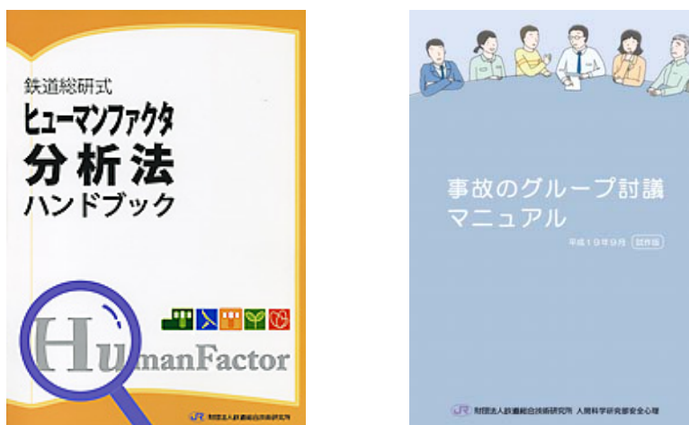
図2 ハンドブックやマニュアルなどの成果の視覚化

点からの研究開発が急増している。「通勤列車における立位客の安全性評価」と「多様な利用者に使いやすい車内支持具の検討」はともに、列車内における安心・安全度を向上させるための取組み、「着座乗客の衝突事故時の挙動と被害の推定」は、事故時の被害を抑えるという観点からの対策提案の研究である（図3）。