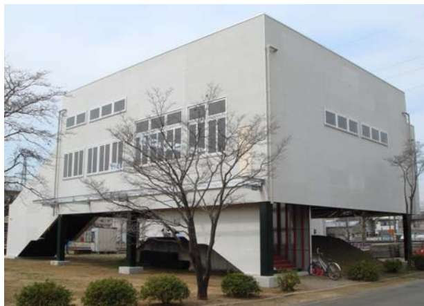
図 4 駅シミュレータの外観

災害や事故などの異常時に、混雑した駅から旅客を安全に避難させることは重要な検討課題であるが、異常時における群集行動については不明な点が多く、効果的な策を立てるには至っていない。このため、改札を含むコンコースや階段などを備えた駅シミュレータを開発した（図 4）。本シミュレータを用いた実験で、群集の速度や行動特性、駅内の構造物の影響などに関わるデータを蓄積し、「駅避難シミュレーション」ソフトの開発へと展開する予定である。