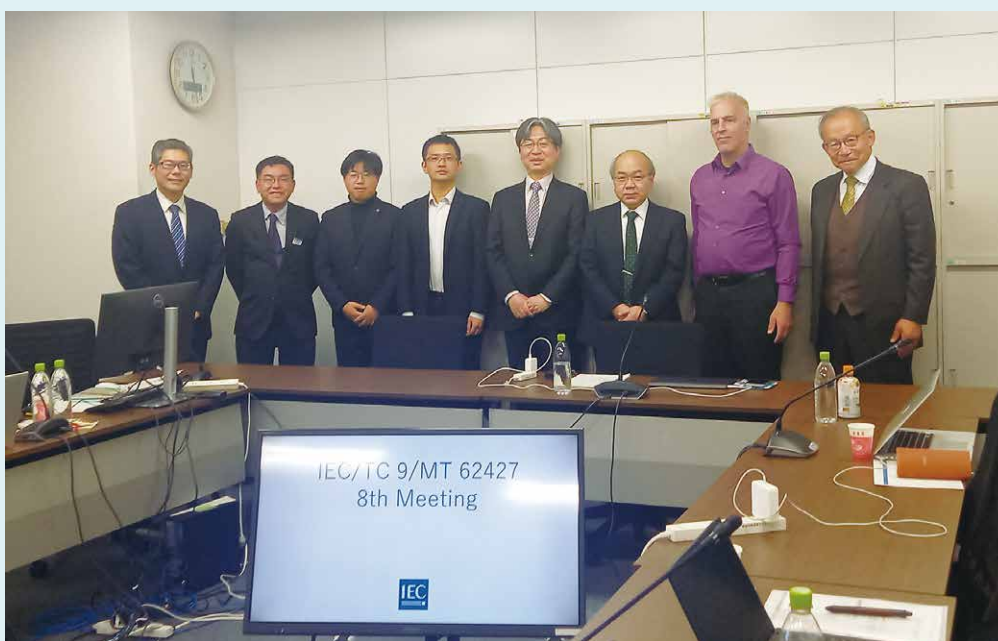
図2 MT 62427のメンバー

④ 2003年版に対して、電磁両立性を確認するための手順のフロー図の一部などを見直す改訂