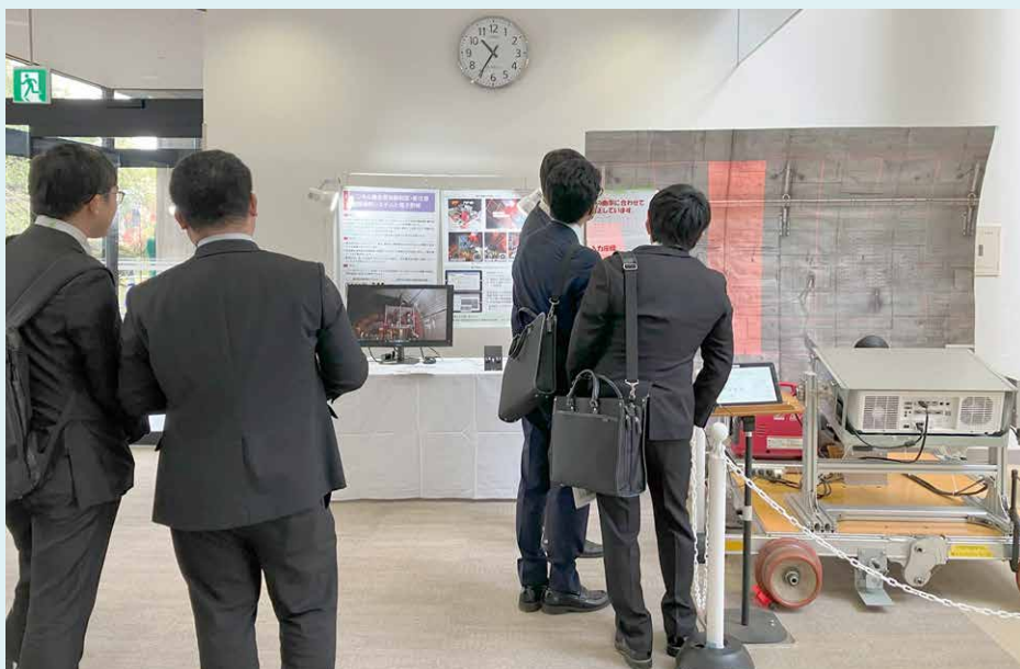
図2 新商品のプレゼンテーション 「トンネル健全度自動判定・要注意箇所投影システムと電子野帳」