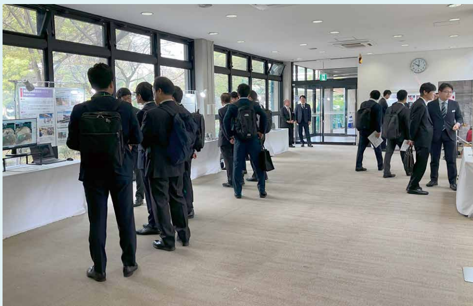
図1 新商品説明会会場の様子