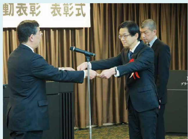
標準化活動組織表彰を受賞した 公益財団法人鉄道総合技術研究所 鉄道国際規格センター 人材育成ワーキンググループ