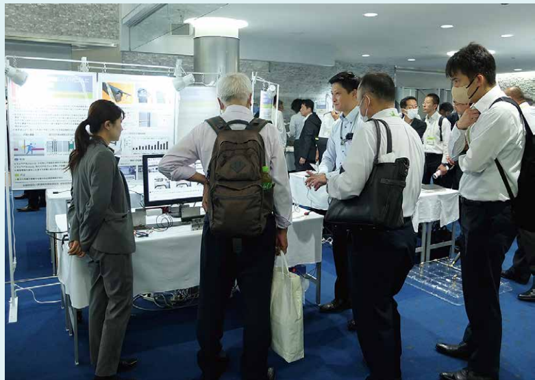
開発成果のプレゼンテーション 「感圧センサを内蔵した戸先ゴムによる戸挟み検知」

また、車両技術研究部、情報通信技術研究部、構造物技術研究部の各部長による基調講演が事前収録され、参加登録者にはYouTubeにより事前配信されたほか、会場でも放映されました。