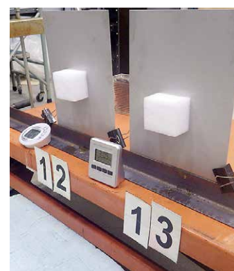
図3 落雪実験の様子