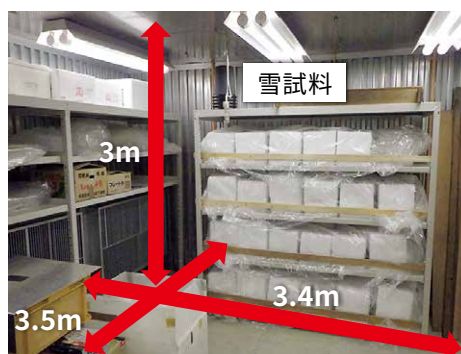
図2 低温実験室の概要 (左図は第一実験室, 右図は第二実験室)