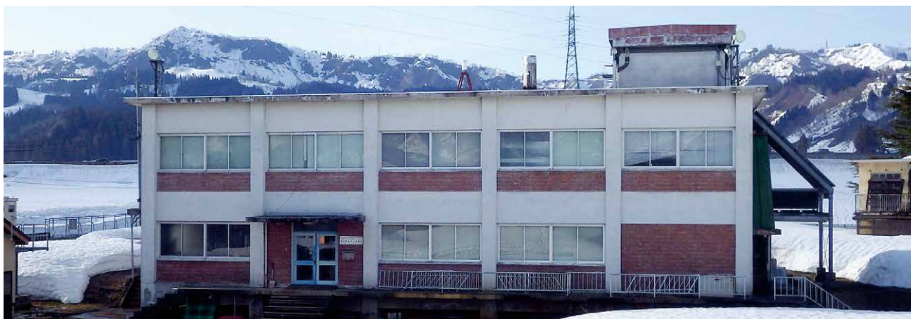
図1 塩沢雪害防止実験所の外観