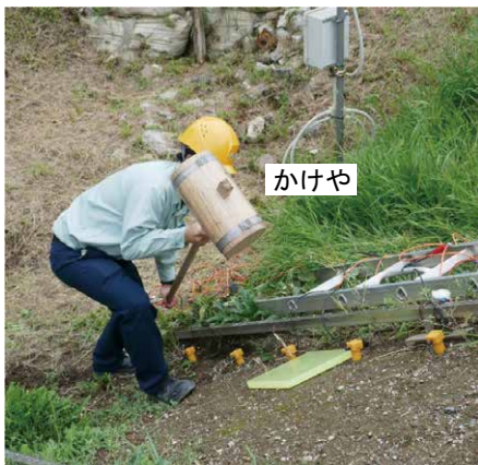
図3 表面波探査の実施状況