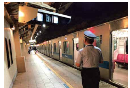
車掌による安全確認の様子