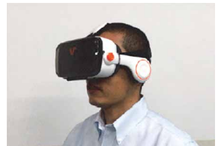
訓練での使用イメージ