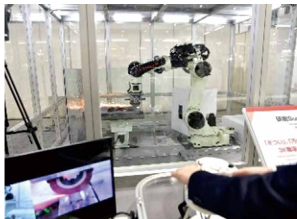
図1 遠隔操縦ロボット