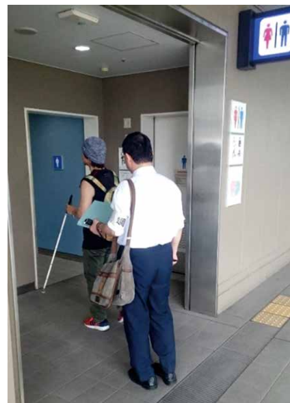
図1 探索調査の様子 (左が参加者で、右は実験者)

いくつかあります。たとえば、トイレ内では限られた空間内に多くの衛生器具を配置する必要やトイレ外から内部が見えないように目隠しする必要から、動線が複雑に折れ曲げられています。これは視覚障害者にとってはいわば迷路のような構造といえます。また、トイレはプライベート性の高い空間で、しかも男女の区別が厳格であるため、介助に限界があり、とくに異性による