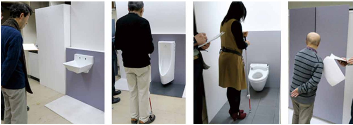
図5 実物大模型を用いた評価実験の様子