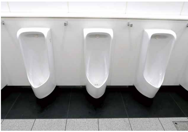
図3 白い腰壁と黒い汚垂石の例