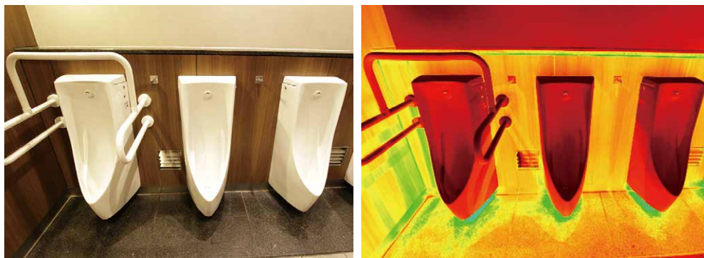
図6 輝度分布を可視化した例(左:元の写真, 右:輝度分布画像)

対する配慮がとくに重要であるといえます。輝度コントラストをうまく設計に活かすことが、使いやすいトイレを実現する近道といえるでしょう。