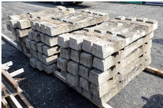
図1 経年PCまくらぎの一例

近年実施されている経年まくらぎの調査などにより、PCまくらぎに発生しうる変状、劣化の傾向はある程度定量的に把握できるようになっています。今後は、設計耐用期間の50年を迎えるPCまくらぎの増加、少子高齢化による人手不足などの社会情勢から、さらなる効率的な維持管理が求められます。これからも本手引きを活用し、鉄道の発展に貢献できるよう取り組んでまいります。