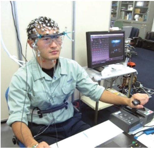
図2 簡易運転シミュレーター運転時の生理計測実験

拘束したり、運転士に負担をかけたりしないよう、画像解析技術を利用します。これには、目立たず、意識させない小型カメラの活用を考えています。