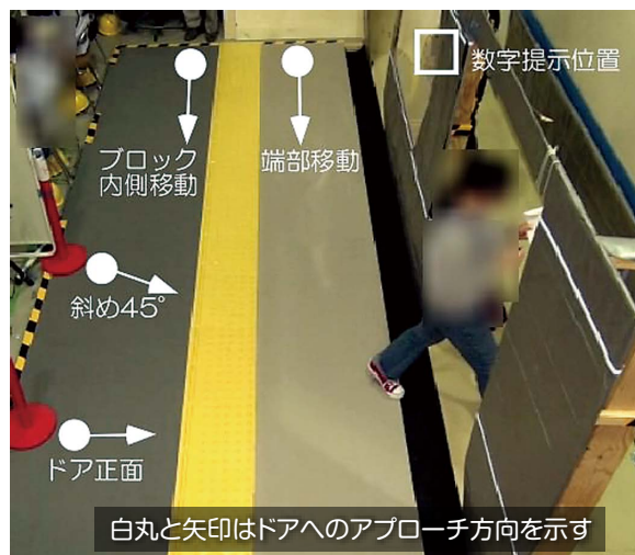
図4 列車・ホーム間の隙間通過時の旅客の挙動を調べる実験

旅客設備利用について意識調査を実施した結果、トイレ便座、エスカレーター手すりなどの順に「触りたくない」割合が高く、その理由として「汚い、菌がいそう」と考えている利用者が多いことがわかりました。一方、設備の接触部位表面の微生物分布を調査した結果、トイレ設備からはヒト由来、エスカレーター・階段からは環境由来の