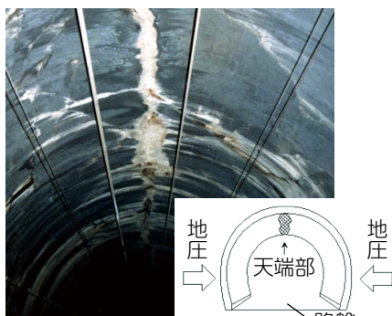
(a)変形したトンネルの例