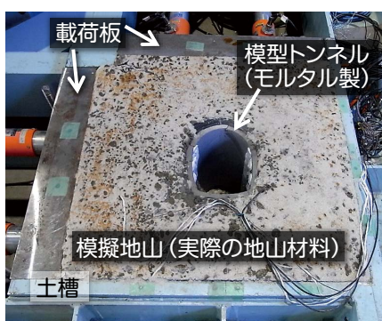
(c)実験状況(土槽蓋を外した状態)