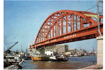
建設中の大阪環状線・安治川橋梁

車窓からの富士山の眺望を確保するために、3径間連続中路プレートガーダーを採用しました。