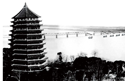
杭州の六和塔と落橋した钱塘江橋梁

青函連絡船や宇高連絡船の水陸連絡設備として設置されていた連絡船可動橋は通車の安全度が低く、とくに三軸のトキ900形貨車がしばしば脱線事故を起こして貨物輸送の隘路となっていました。戦時下における貨物輸送を確保するため、連絡船可動橋の改良に携わることとなりましたが、連絡船可動橋の設計方法については海外でも体系化された手法は確立されていなかったため、潮の干満、波浪、船の積載量など基礎データの測定から始め、許容される勾配変化角度や横方向の傾斜角、ねじれ角度を理論的に求め、桁の支点やレール締結装置に改良を加えた新しい構造の可動橋を設計しました。