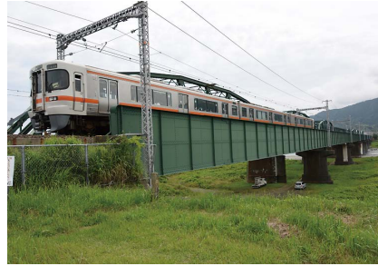
東海道本線・富士川橋梁(上り線)