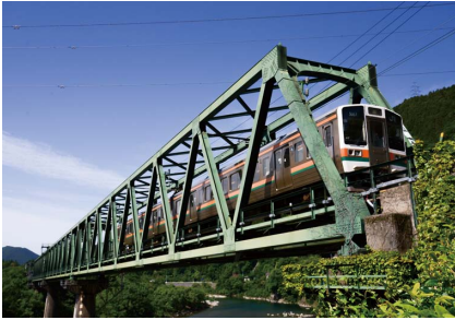
飯田線・天竜川橋梁