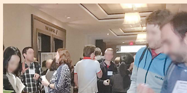
セッション間の会場の様子

滞在中には路面電車を利用しました。地元の方々はこちらから声をかけずとも路面電車の乗り方や道を教えてくれるなどニューオーリンズの方々のフレンドリーさを感じました。また、道を歩いているとさまざまな店舗や通りから多様なジャンルのジャズが流れてくるのを聴くことができ、ジャズの聖地とよばれる所以を垣間見ることができました。