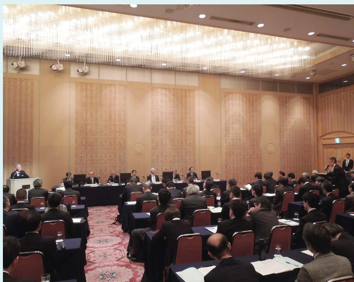
ディスカッションでの質疑