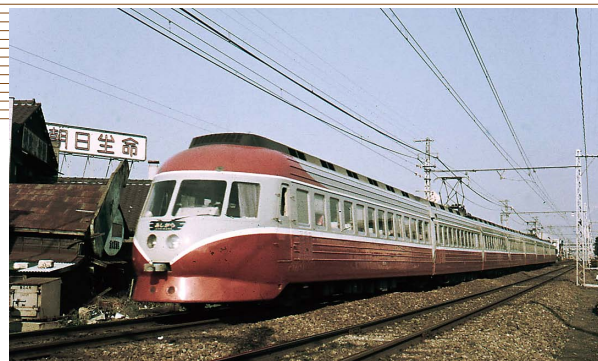
1957(昭和32)年に登場した小田急3000形特急電車