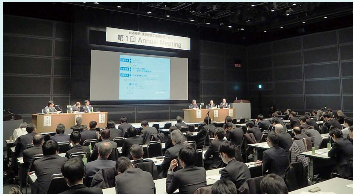
パネル・ディスカッション