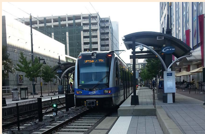
会場付近に停車するトラム (Lynx blue line)

発表では、超電導を用いたフライホイール蓄電装置を報告しました。会場では、本装置に対する期待が寄せられるとともに、ドイツのフライホイール蓄電装置研究者と議論・交流を行いました。