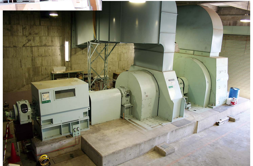
③周波数変換機近影(全景) 左から起動用誘導電動機、50Hz同期 電動機、60Hz同期発電機