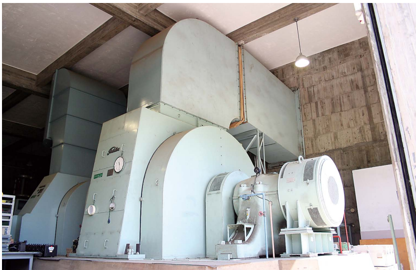
②周波数変換機近影(60Hz同期発電機側) 軸受形状に製作時の面影を残す