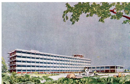
④国立研究所完成予想図