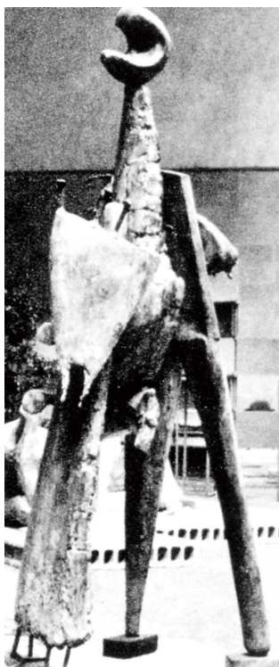
③第24回新制作協会展に出品された「トリ(国鉄技術研究所広場のためのモニュマン)」