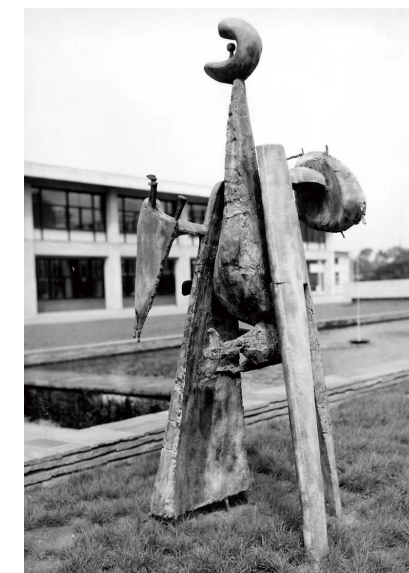
⑥設置された頃の彫刻