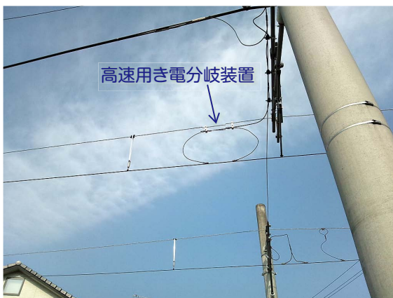
図1 高速用き電分岐装置の取付状況