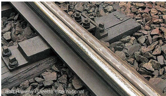
基本レール上の波状摩耗の形成。トングレールは研削済

分岐器区間では、基本レールは短波長の波状摩耗が、トングレールは乗移り箇所での局所摩耗が観測される。このように、多くの場合レール摩耗のパターンが一般区間と異なり、解決すべき技術的課題が少なくない。本文では、分岐器区間のレール摩耗の特徴を分析して、レール転がり接触疲労 (RCF) の管理を研削工程に組み入れるための技術的解決を試みている。