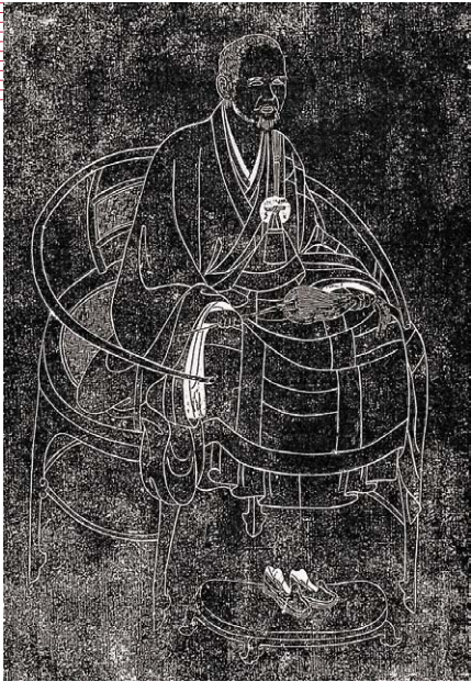
③天童宏智老人像碑拓本 (中国浙江省寧波市天童寺)