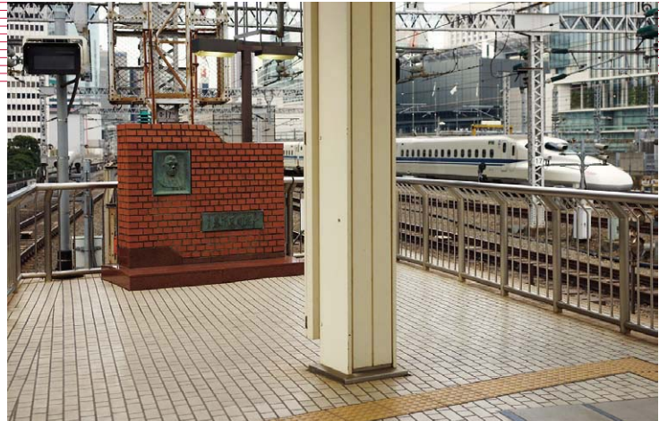
⑤東京駅18/19番線プラットフォームにある新幹線開業碑