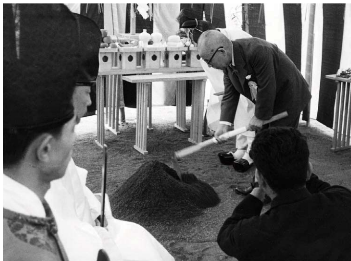
②国立研究所の鋤入れを行う十河総裁 1958（昭和33）年10月16日