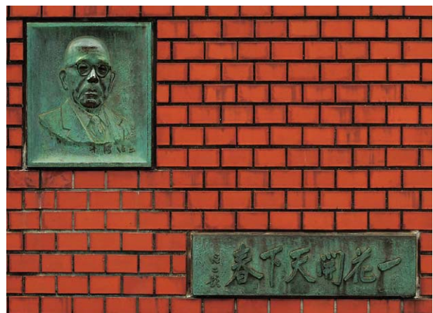
⑥新幹線開業碑の碑面と「一花開天下春」