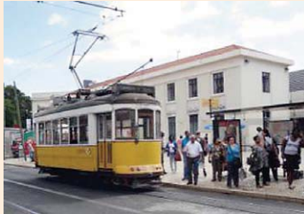
リスボン市内を走る市電

正式名称：15th World Conference on Earthquake Engineering 開催国：ポルトガル(リスボン) 期間：2012/9/24～28 主催：International Association for Earthquake Engineering (IAEE) 次回開催予定：2016年 ホームページURL：http://15wcee.org/