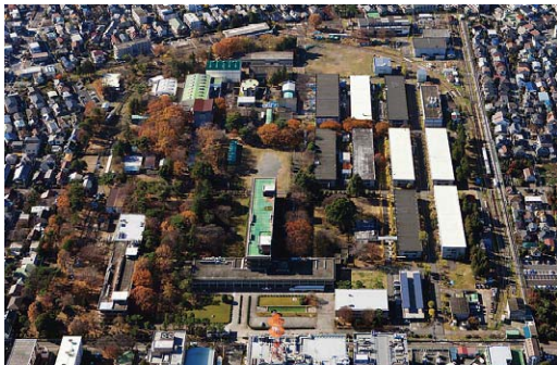
⑥現在の国立研究所とその周辺