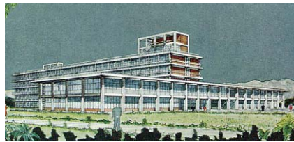
①国立研究所完成予想図 低層の管理棟と研究棟がT字型で交差する。

モダニズム建築が一般化されるのは戦後になってからで、鉄道建築では三代目京都駅(1952年)などが登場しますが、