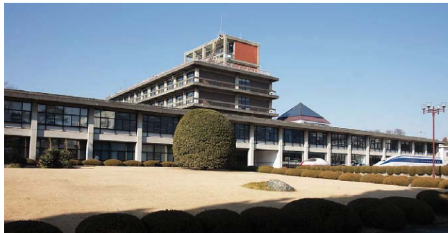
⑦現在の研究棟と管理棟

招いて起工式を行い、1959(昭和34)年10月には本所機能を国立へ移転し、1960(昭和35)年10月に第一期工事の完成披露が行われました。