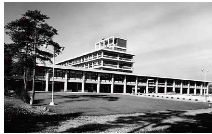
②完成したばかりの国立研究所