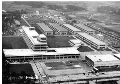
③完成したばかりの国立研究所構内とARC (アジア各国鉄道首脳懇談会) 鉄道展示会 (1960.10.17)

国立研究所も当時の最先端であったコルビュジエ流の建築思想の影響を色濃く受けて設計された建築のひとつです。