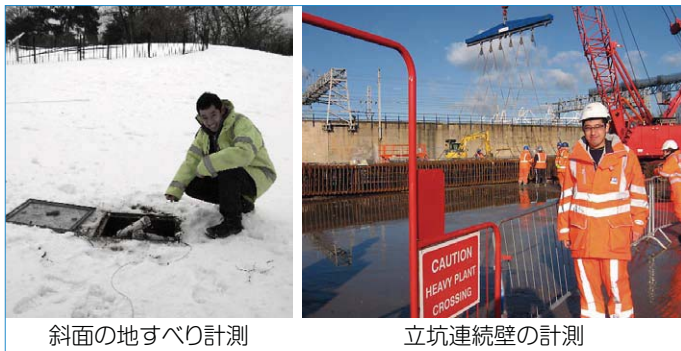
斜面の地すべり計測 立坑連続壁の計測