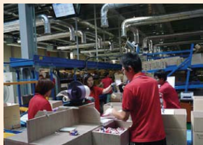
見学会で紹介された物流施設の様子

物流に関する各種課題、環境問題、SCM (Supply Chain Management) モデルの開発、鉄道を含むインターモーダル輸送、情報技術などに対して最先端の研究や状況報告など、合計69編の論文発表がありました。また、釜山新港にある物流施設を巡る見学会が実施されました。港埠頭施設を見学し、鉄道路線導入等の施設計画を伺い、交通・物流に対する韓国の計画・作業・ITシステムを一体化する先進性を強く感じることができました。