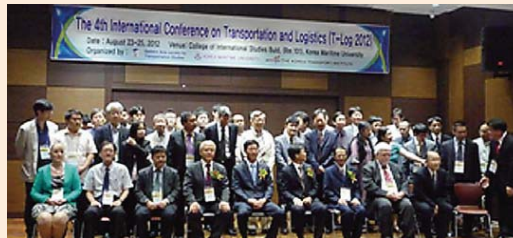
出席者の記念写真