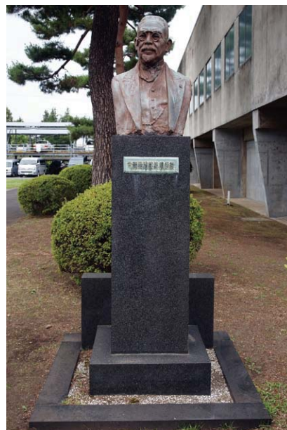
②「鉄道院総裁後藤新平」胸像 鉄道総研の講堂横に鎮座し、鉄道の未来を見守っている。

1908(明治41)年に、通信大臣に就任し、発足したばかりの鉄道院総裁を兼任しました。さらに、内務大臣、外務大臣などを歴任し、1920(大正9)年には東京市長となり、1923(大正12)年の関東大震災後に創設された帝都復興院総裁に就任して、震災復興事業を推進しました。このほか、日本少年団