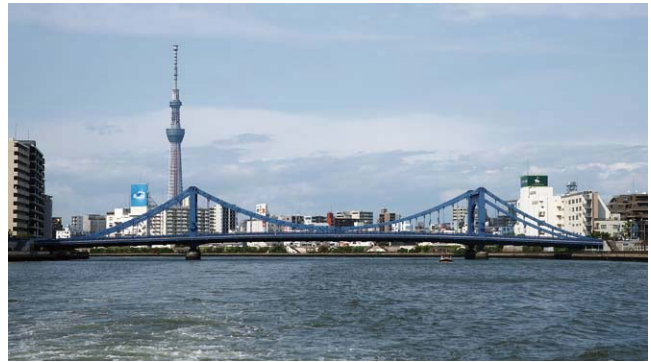
④現在の清洲橋(国指定重要文化財)

東京—下関間の広軌改築の具体的計画を示した図面。 『広軌鉄道改築準備委員会調査始末一斑』広軌鉄道改築準備委員会(1911)より