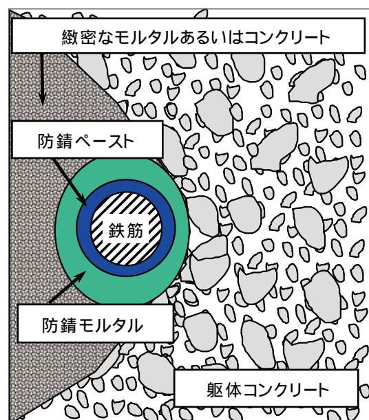
図4 塩害抑制工法の模式図

コンクリートの劣化メカニズムを理解することで劣化の進行性、劣化の抑制方法が明確になってきます。今回の内容は、補修材の開発はもとより、劣化のメカニズムを解明した賜物であると考えています。