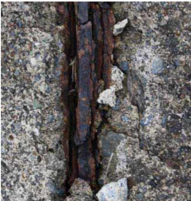
図1 鉄筋コンクリートの塩害の状況

当初の研究内容は、コンクリートの劣化メカニズムの解明でした。このことがわからないと間違った補修を行ってしまう危険性があることから、重要な研究課題です。このため、鉄道会社のコンクリート構造物を数多く調査・診断