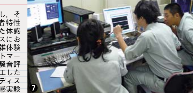
①車内快適性シミュレータで目的に応じた車内環境を模擬し、そこに必要な計測装置を設置することで、さまざまな利用者特性を測定しています。②③④鉄道利用者に実場面を想定した体感評価を行っていただいているところです(②は多目的スペースにおけるベビーカー使用体験、③は通勤ラッシュを想定した混雑体験で、ピンクボールは頭部の揺れを記録するためのターゲットマーカー、④はつり革の握まりやすさの調査です)。⑤車内振動騒音評価シミュレータで実際の走行振動や車内騒音の再現と、加工した振動・騒音を起こす準備をしています。⑥ヘッドマウントディスプレイを装着して風景も体感できます。⑦振動・騒音の体感実験を実施し、データを取得しています。