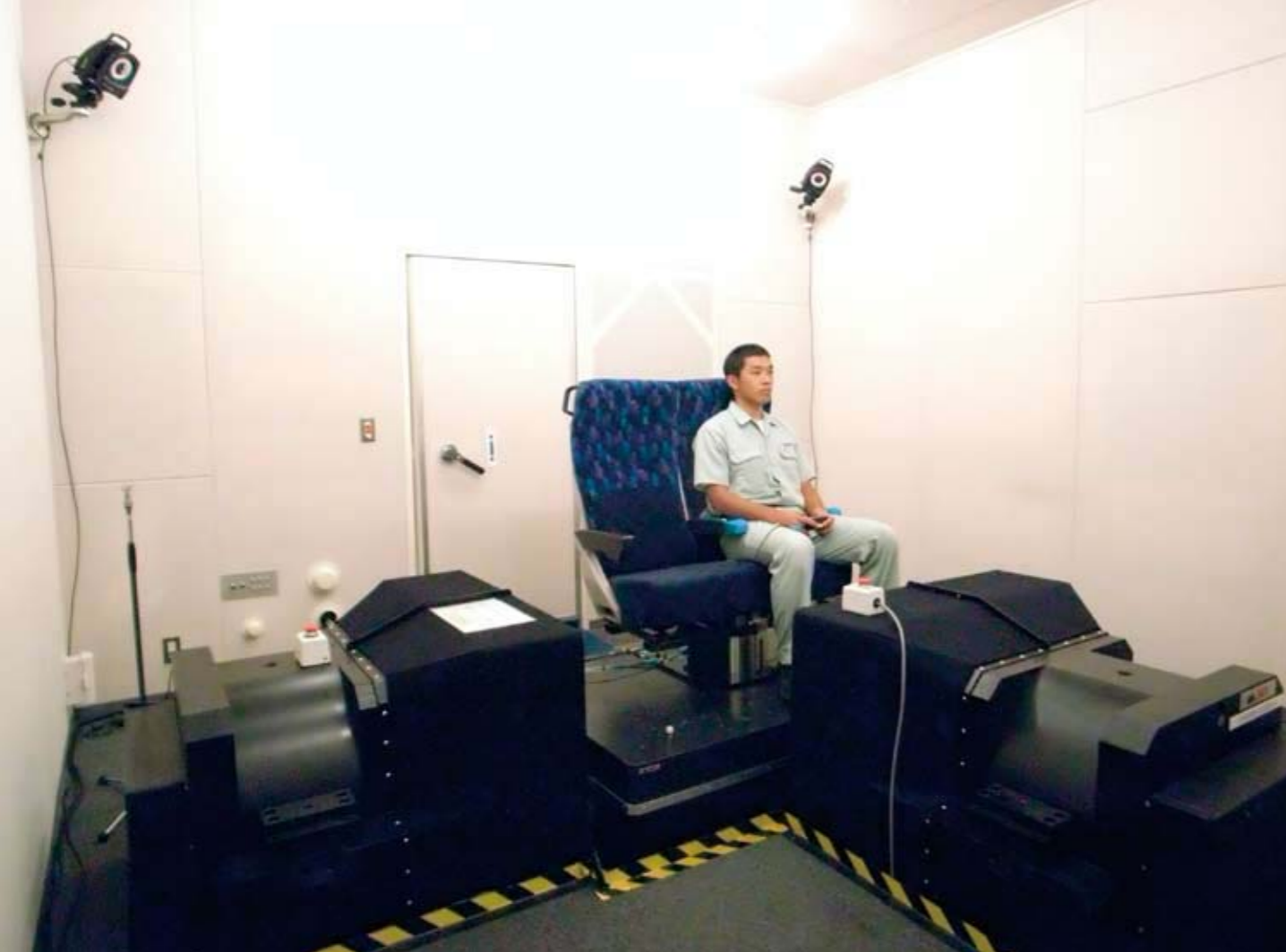
写真は車内振動騒音評価シミュレータで、振動乗り心地の評価を行っているところです。この装置では新幹線が高速走行する際などに客室で感じる特徴的な高い周波数の揺れや、低い周波数の音を精度よく再現することができます。乗り心地の向上を目指し、振動や騒音に対して利用者がどのように感じているのかを定量的に評価するための研究が進められています。