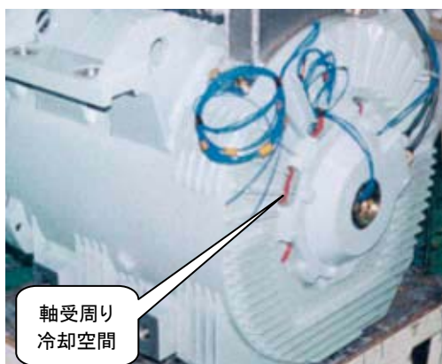
図3 軸受周り冷却空間