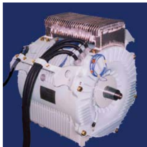
図4 鉄道総研が開発した全閉形電動機の外観