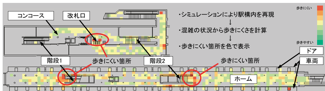
図 旅客流動評価シミュレーション