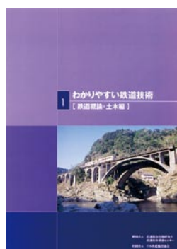
鉄道概論・土木編 1,575円(税込)