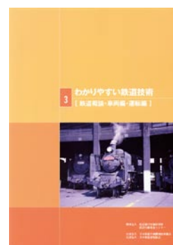
鉄道概論・車両編・運転編 2,300円(税込)

●▶ ご注文は(財)研友社へ(FAX 042-572-7190) http://www.kenf.or.jp/