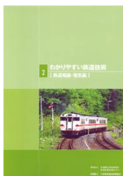
鉄道概論・電気編 2,100円(税込)