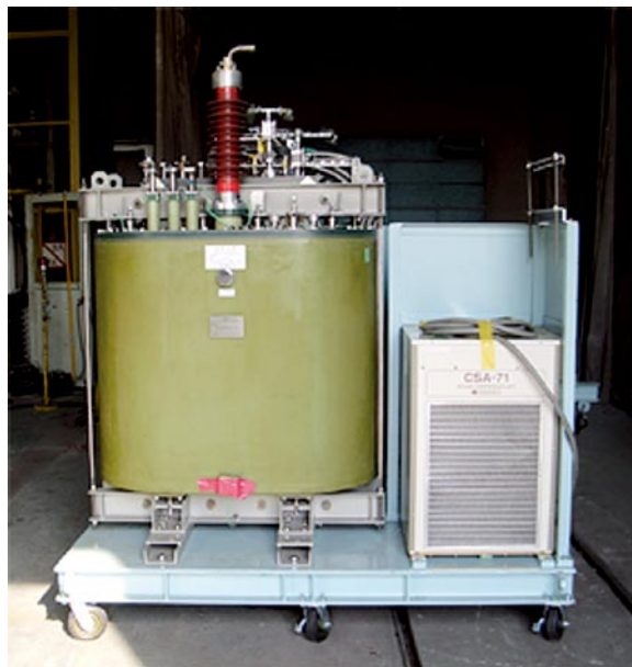
図 低交流損失超電導線による巻線および軽量、大容量な冷却システムを組み込んだ超電導主変圧器