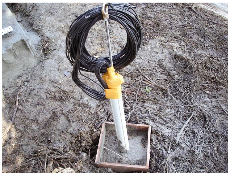
図4 地下水成分に表れる地すべり予兆を確認するため、地盤の変位を計測する地中変位計。深さごとの地盤の曲がり具合を測定する傾斜計が、この筒の中に深さ1mごとに入っている。

地下水成分の濃度上昇と地中変位計によって検知された斜面土塊の動きとは、よく関連しています。この試験地では、地下水中のカルシウムイオン濃度の上昇後、平均して約60日後に斜面の変位を地中変位計により検知しました。地下水成分を現地のその場で連続的に観測でき、図5に示