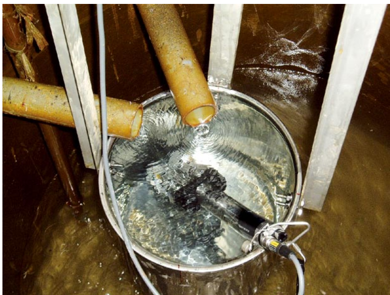
図2 集水井戸の中にたまった地下水につけている化学センサー。地下水成分を連続分析している。

保線区から地すべり現地までがそう遠くない場合であれば、現地の監視もかねて地下水採取に行っていたことも考え方のひとつでした。しかし、現地が遠かったりすることも少なくありません。そこで、このわずらわしさを解消する必要が出てきました。地すべりによって地下水成分が変化するときには、濃度が数倍から、場合によっては10倍程度も変化することがあります。実験室的な化学分析の精度を必要としないのであれば、pHメーターと同じ原理で