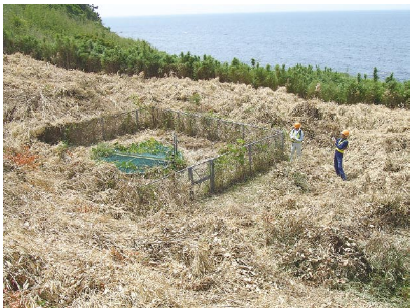
図1 地すべり斜面に設置された集水井戸の例。この井戸の深さは20mであるが、地すべりの規模によっては深さが30mを超えるものもある。

実際の地すべり地区では、地すべり斜面の土塊の自重を減らすため、しみ込んだ地下水をしばらく出す排水工が設けられています。地下水位が高く、地下水量が多い場合には、効率的な排水を促すため、大きな井戸を掘り、これに何十本もの水抜きパイプを接続して平面的にも断面的にも広範囲な排水を行ないます(図1)。ここに集められた地下水は、地すべり土塊を通過してきたものですから、当該地盤の風化の状況を地下水成分の化学状態として四六時中提供して