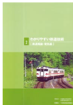
鉄道概論・電気編 2,100円(税込)