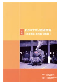
鉄道概論・車両編・運転編 2,300円(税込)

◆▶ ご注文は(財)研友社へ(FAX 042-572-7190) http://www.kenf.or.jp/