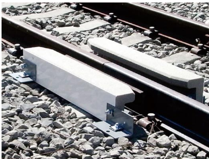
図 レール継目用防音材の設置状況

レール継目部から発生する騒音の対策材として開発したレール継目用防音材の構造を示す図である。