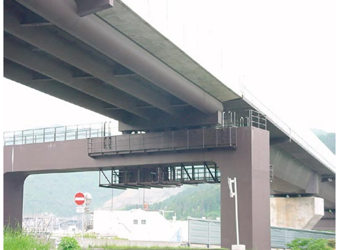
図 世界で初めてNi系高耐候性鋼材を採用した北陸新幹線 北陸道架道橋