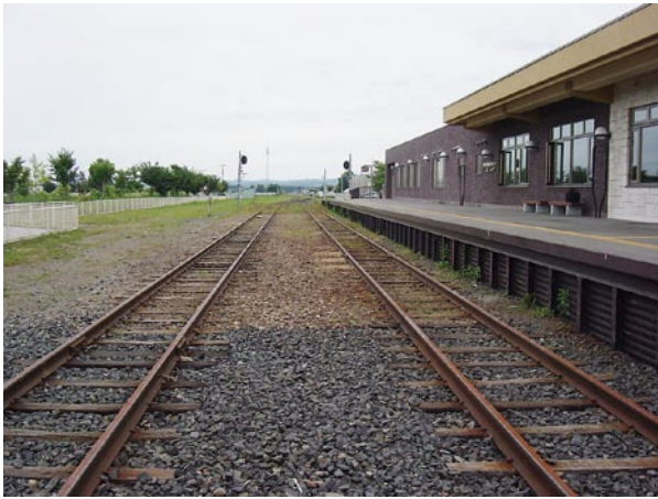
図2 線路に再び列車が通ることはない(旧訓子府駅)

年数切れの問題が浮上し、その改善には30億円近くの経費が必要と見積られました。ふるさと銀河線は、通学定期の割引率を低く設定していたこともあり、いわば100%補助金で運営してきたようなものでした。また、様々な増収策を講じましたが、その効果は限定的でした。