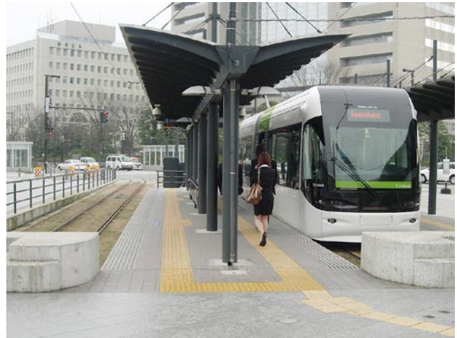
図6 富山ライトレール

や「国や事業者への要望」のような取組みだけでは限界に行き当たっていることが示唆されています。鉄道整備では利害意識が生じやすいため沿線住民のみならず、地域全体に便益が行きわたるような仕組みが必要です。バスを含めて、地域の公共交通はどうあるべきかを議論するなど、NPO法人などの市民団体による活動が自治体を動かす例が見られます。富山市では自治体と市民が「一丸」となってこの問題に取り組み、「富山ライトレール」の開業(図6)やJR高山本線活性化に向けた社会実験開始につながっています。