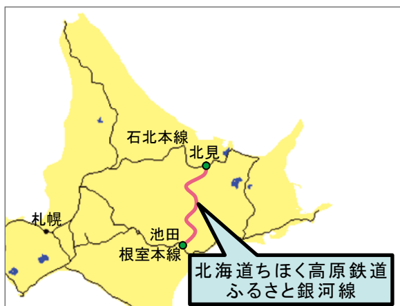
図1 「ふるさと銀河線」位置図