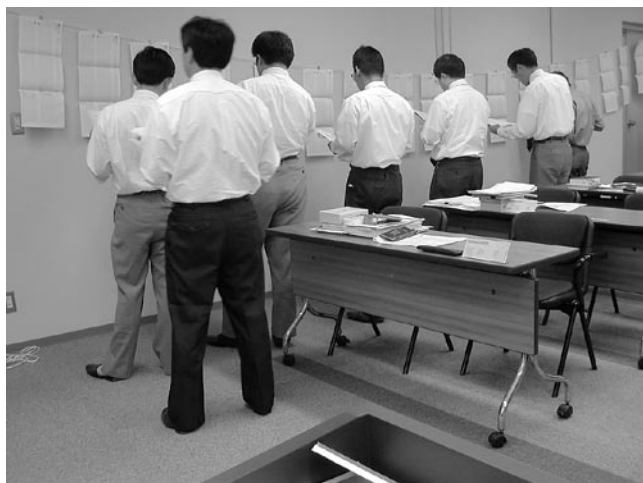
図3 クレペリンの判定訓練の様子