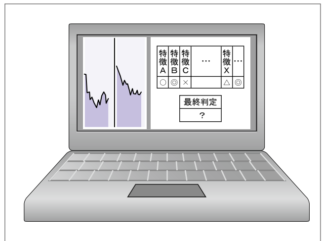
図2 システムの概要