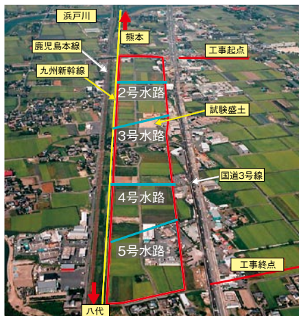
図1 熊本車両基地の全景