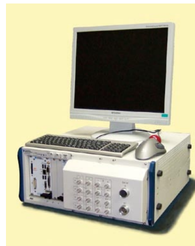
図2 PQ測定処理システム本体