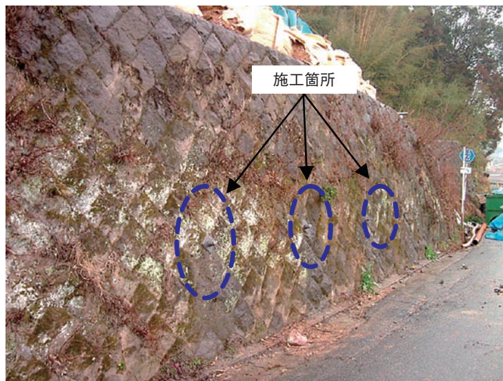
図3 施工後の壁面の状況