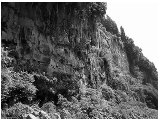
図1 岩盤斜面の例 (溶結凝灰岩、縦方向に入る節理は冷却節理)