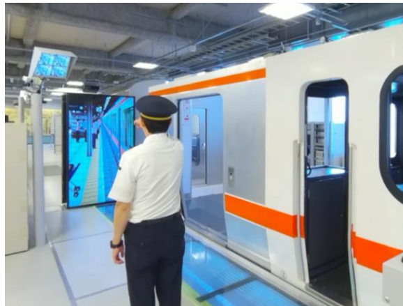
図 2 第三者視点の VR 映像例