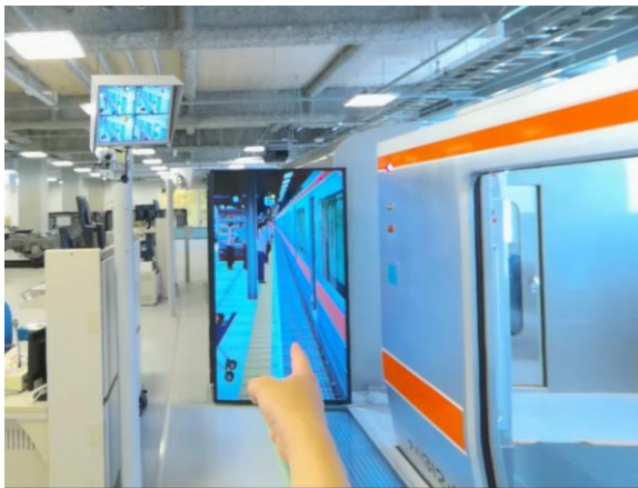
図 1 主観視点の VR 映像例

両教材で学習者が VR 空間内を任意に移動する機能はない。VR 空間では撮影時のカメラ位置に基づく視点が正面に固定されていたが、頭を動かすことで視点のみ変更可能である。主観視点教材では学習者が模範演技者と同じ視点になるように頭を動かすことが学習時に求められる操作であり、第三者視点教材では動作を覚えるために模範演技を観察することが学習時に求められる。両教材の再生時間はともに約 4 分 18 秒である。教材に含まれる音声は模範演技者が実施する動作音および指差確認時の発声のみであり、解説音声などの付加的情報は含まれていない。