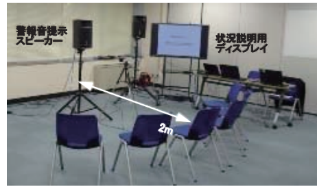
図2 実験装置の配置

音は，継続音，単発音，ボイスごとにランダムな順序で提示した。音圧はマイク位置で73dBと67dBの大小2種類とし，提示順序が半数ずつとなるように割り当てた。1音ごとに，「警告感」，「緊急性」，「落ち着きを失わせる感じ」について5段階，「既存の音と取り違える可能性」について7段階で評価を求めた。