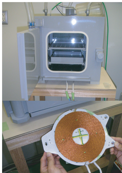
a.インキュベーター、b.曝露用平面コイル