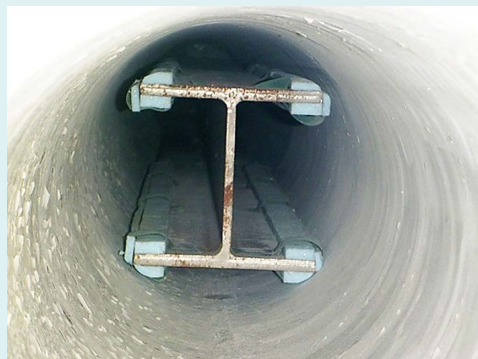
芯材としてH鋼を挿入した例

本工法は、想定以上の地震動に対する倒壊防止工法として従来の耐震補強工法と併用することも可能です。さらには、本工法では、挿入した芯材とPC電化柱との隙間をウレタン樹脂などで埋めて一体化させることにより、電化柱の振動の固有周期を短くして土木構造物との共振を避け、地震時の応答変位を抑制する効果も期待されます。